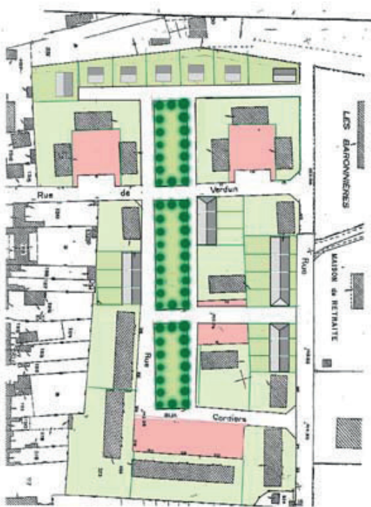
Renouvellement urbain et résidentialisation de quartiers d'habitat social