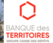
Action Cœur de Ville – Lot 6 Ingénierie de projets – tourisme, loisirs & culture