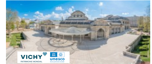
Schéma de développement touristique Vichy Destinations