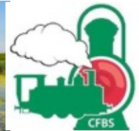
AMO projet de développement du Chemin de Fer de la Baie de Somme