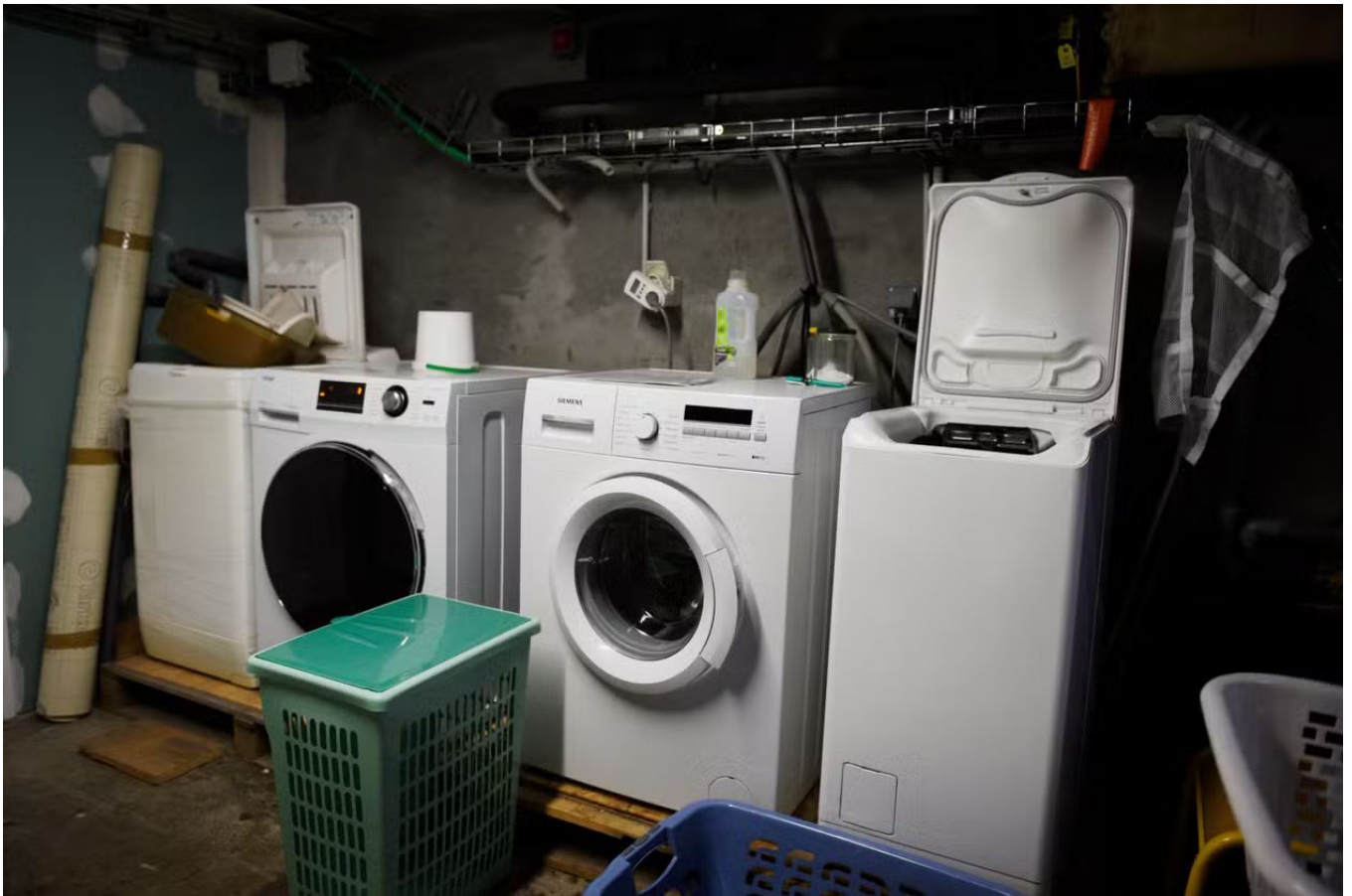
La buanderie avec ses machines à laver en commun, où chacun note ses lessives. A Malaunay (Seine-Maritime), le 16 décembre 2024.