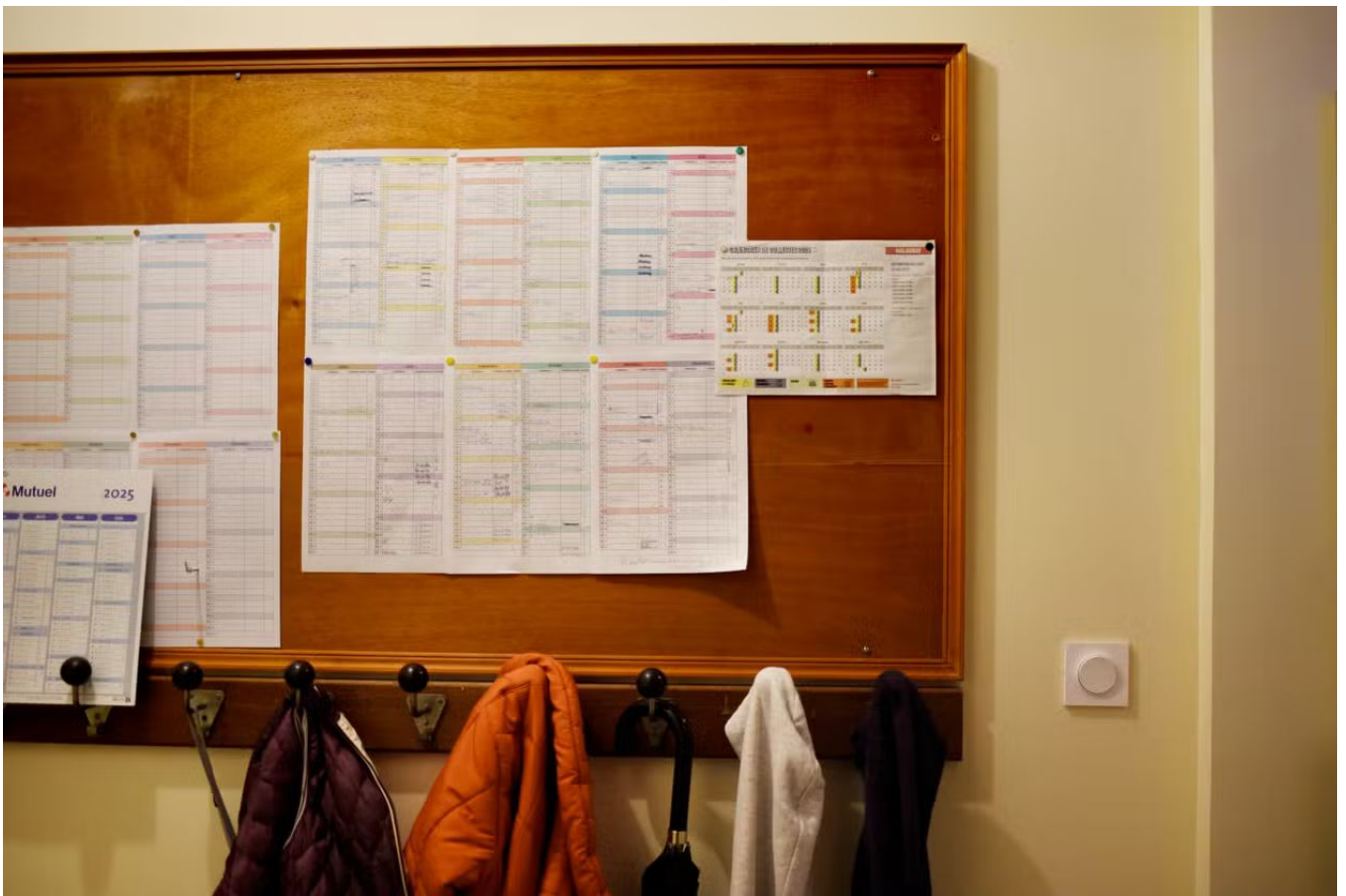
Le planning commun de gestion de l'habitat. A Malaunay (Seine-Maritime), le 16 décembre 2024.